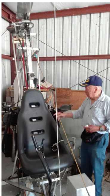
Jewgo 老先生和他的 Gyro 直升机