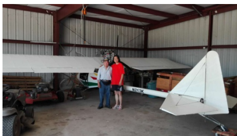
Jewgo 老先生和他的小飞机