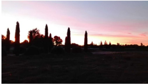
晚霞映照在我们的新家园