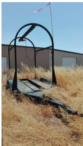
Jewgo 老先生 80 岁时用这个架子把小飞机从德州拖回来